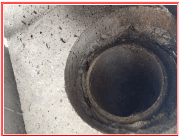
S1 - 2 (S1)