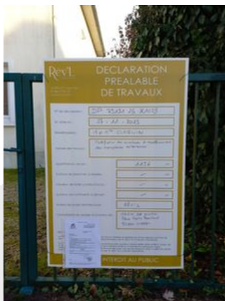
Affichage Dp 2