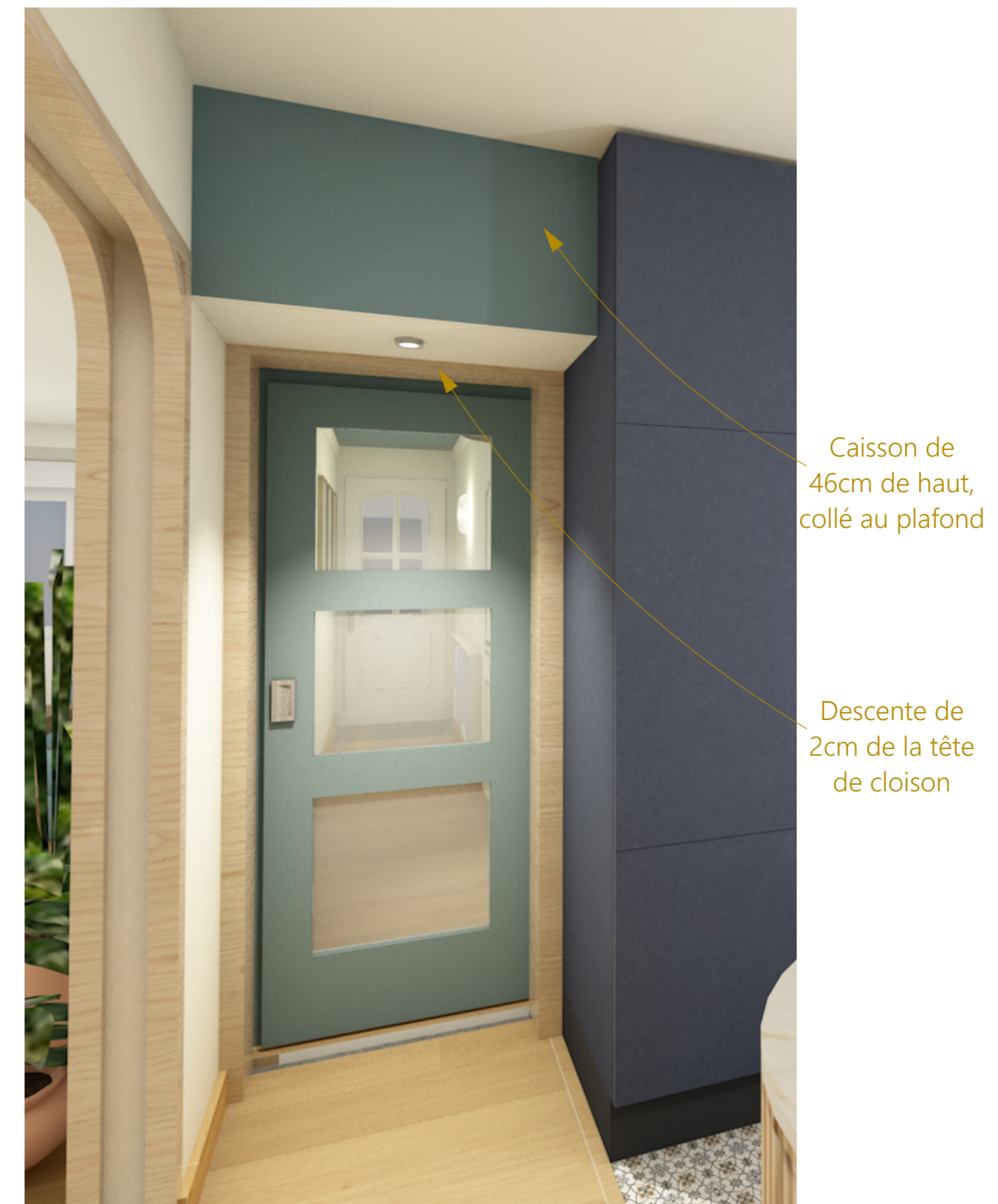
Vue depuis le salon/cuisine