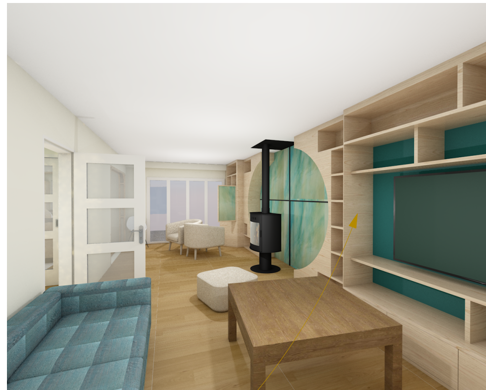
Espace TV / Bibliothèques / Déco