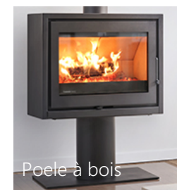
Poele à bois