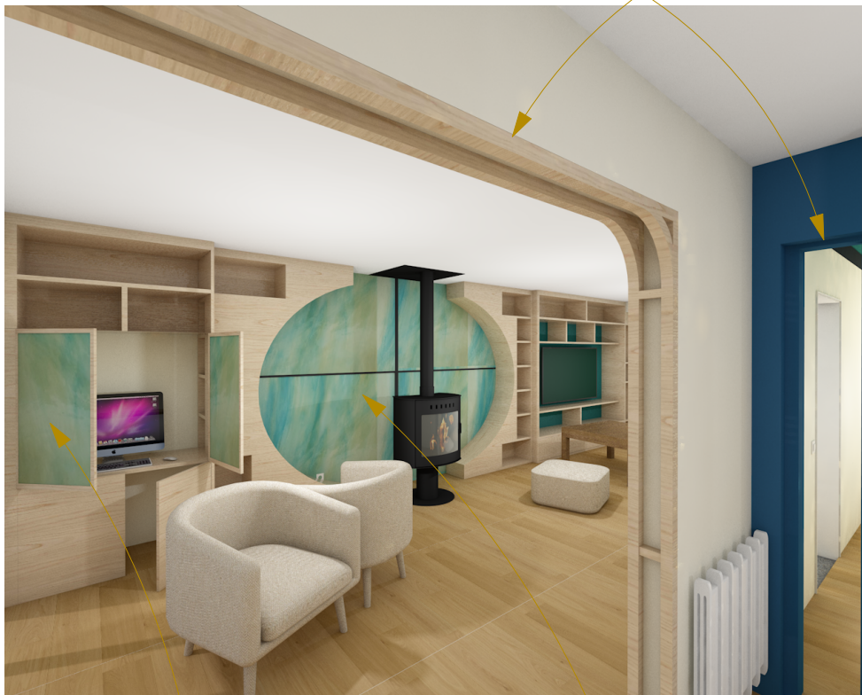
Portes battantes cachant le bureau de Monsieur, avec insertion d'un vitrail à concevoir