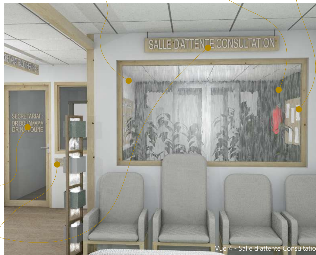
Vue 4 - Salle d'attente Consultation

Signalétique support bois + lettrage blanc en relief