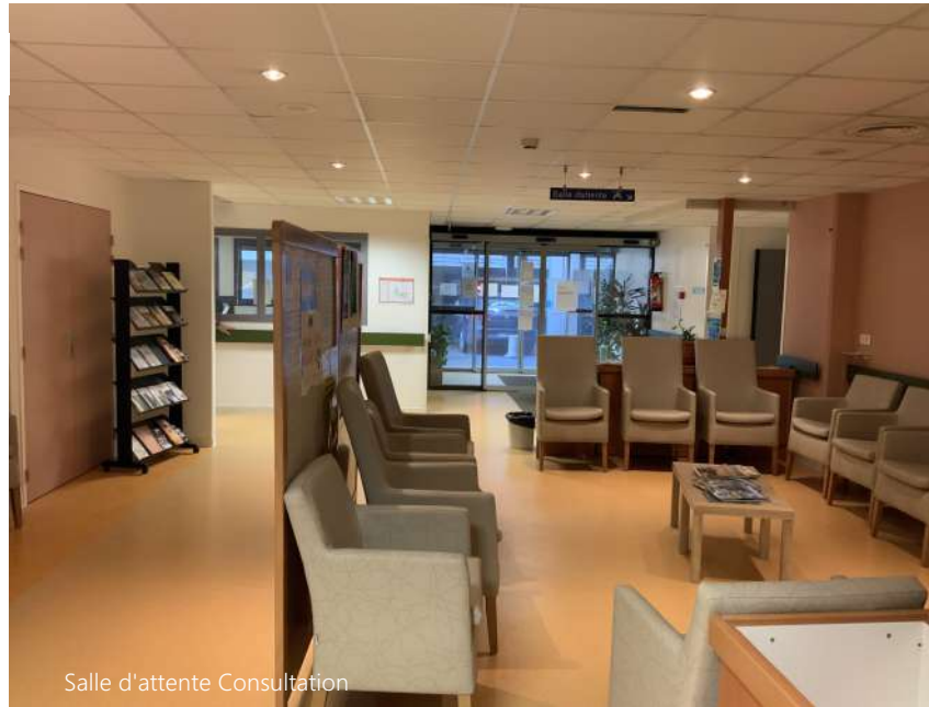
Salle d'attente Consultation