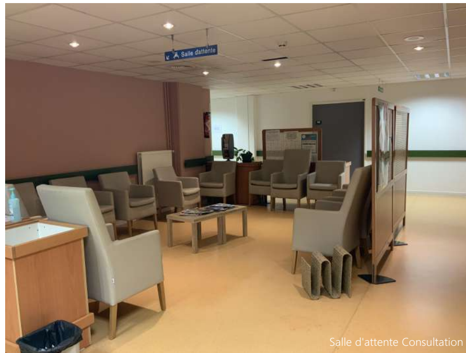
Salle d'attente Consultation