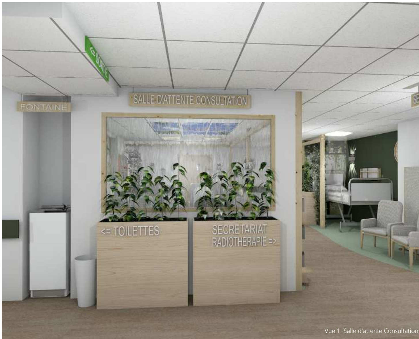
Vue 1 -Salle d'attente Consultation