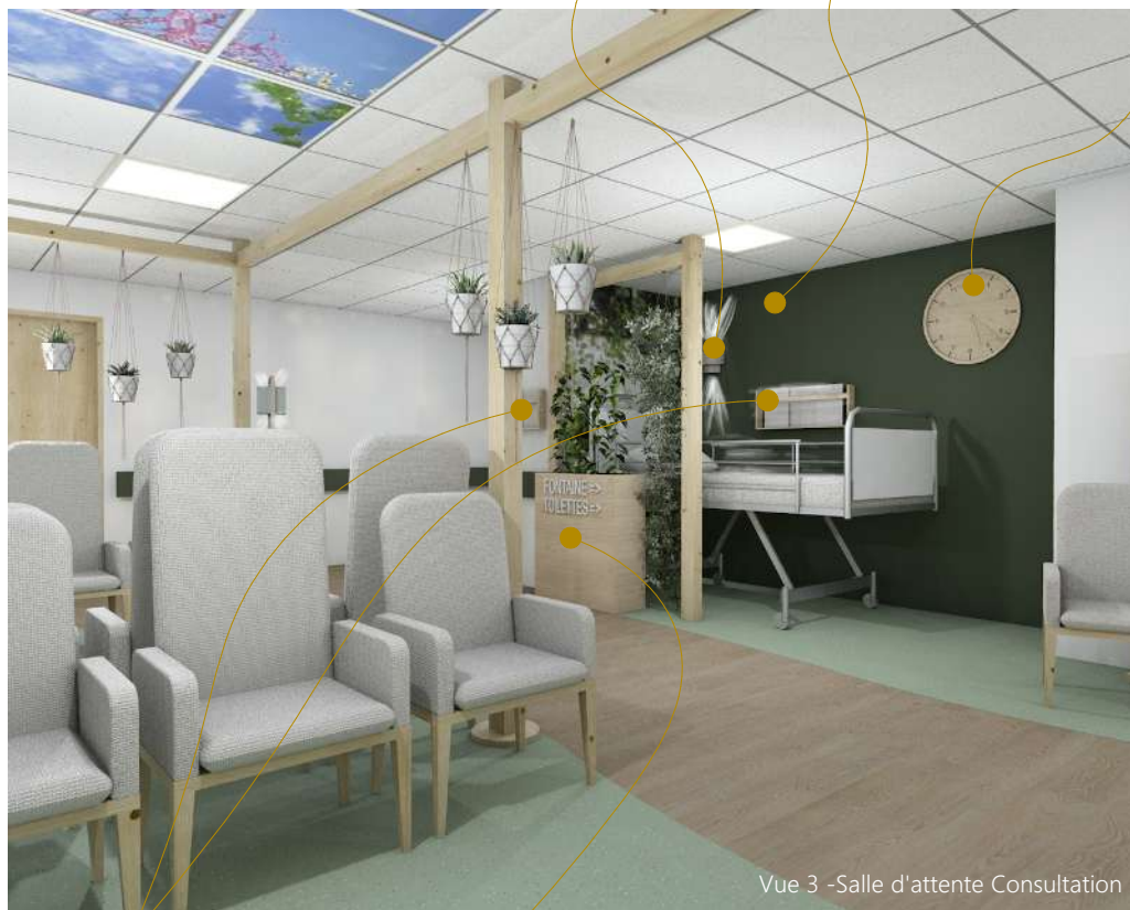
Vue 3 -Salle d'attente Consultation