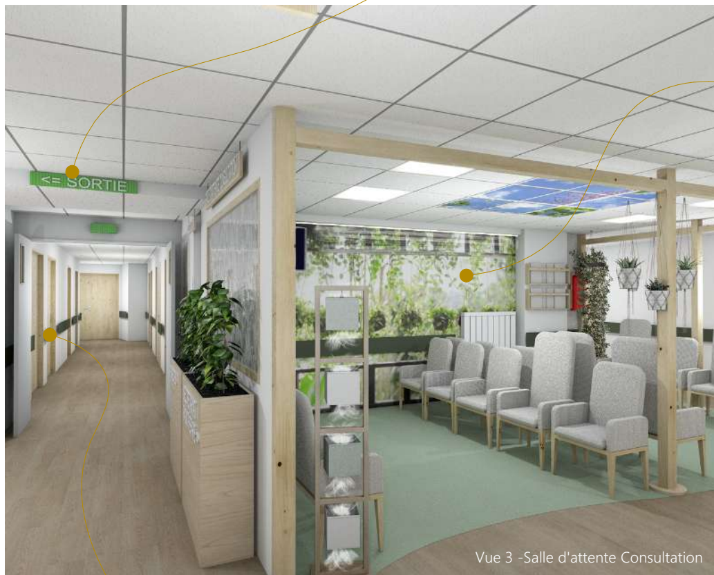
Vue 3 - Salle d'attente Consultation