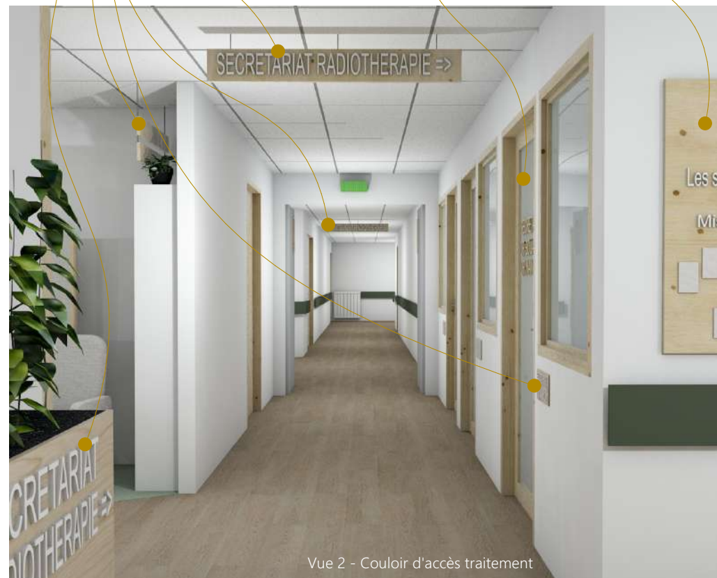
Vue 2 - Couloir d'accès traitement

Impression laser sur panneau bois (présentation de l'équipe imprimée + punaises pour les photos)