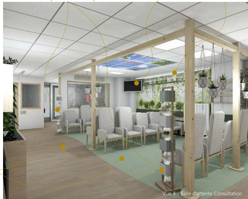
Vue 4 - Salle d'attente Consultation

Mains courantes peintes en vert et film covering bois sur les portes (ou peinture verte)