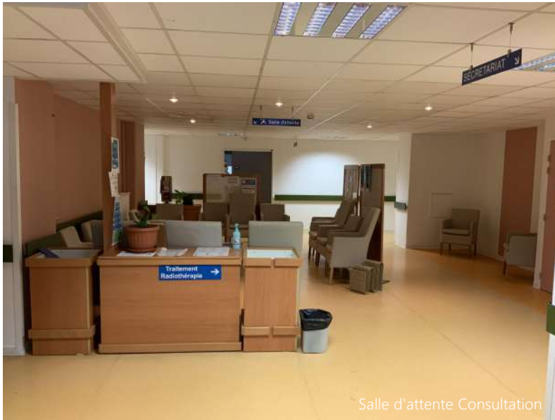
Salle d'attente Consultation