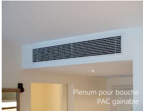
Plenum pour bouche PAC gainable