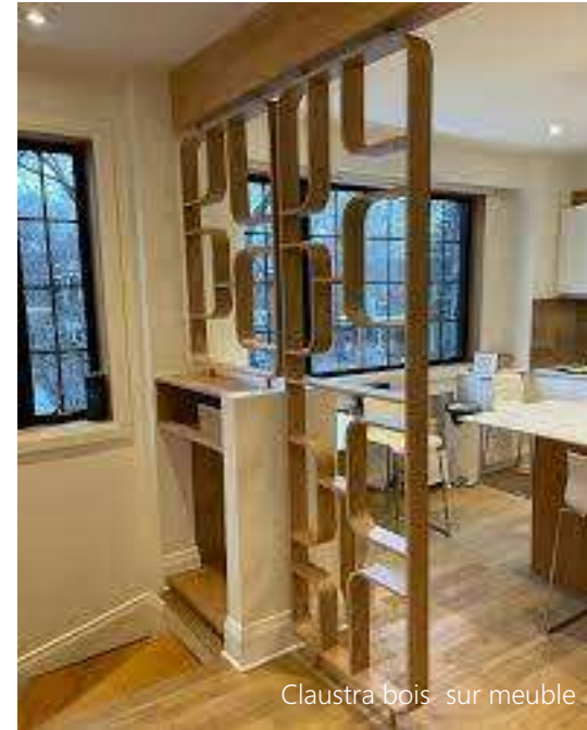
Claustra bois sur meuble