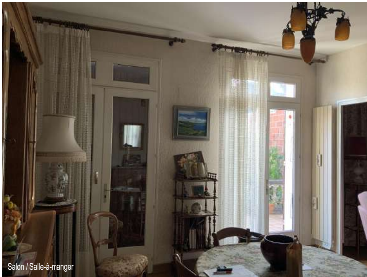
Salon / Salle-à-manger