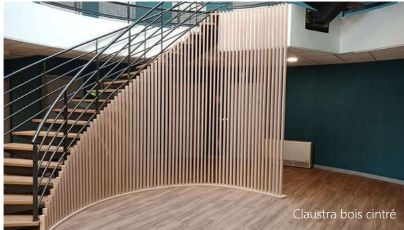
Claustra bois cintré