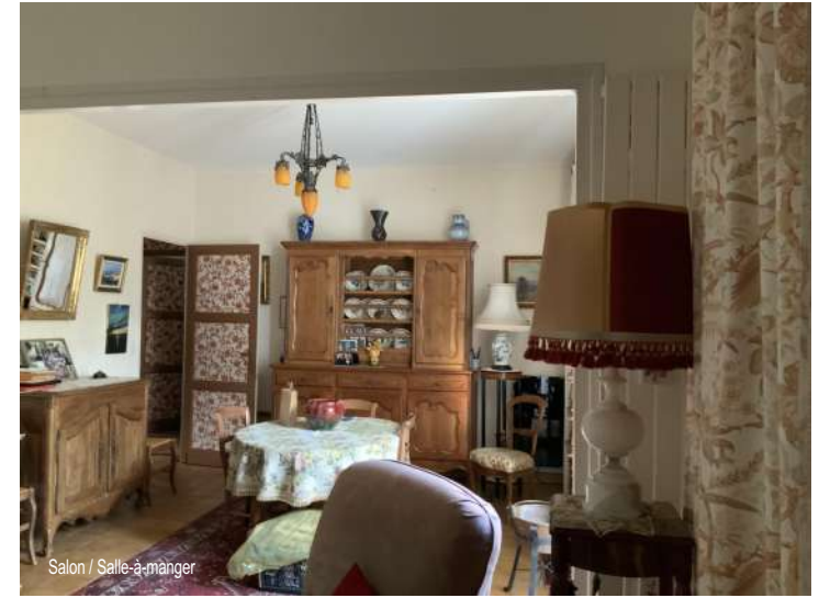
Salon / Salle-à-manger