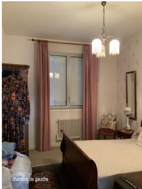
chambre de gauche